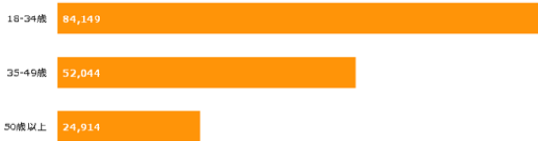
図表3:2021年11月 動画ストリーミング、音声ストリーミング トータルデジタル視聴者数Top 5の年代別GRP%

Source: デジタルコンテンツ視聴率 2021年11月 Monthly Totalレポート ※18歳以上男女 ※トータルデジタル=PCとモバイルの重複を除いた数値 ※Brand及びSub-Brandレベルでの集計 ※利用とは閲覧のみの利用も含みます